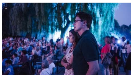
Besucher im Park - NDR Open Air Oper 2018