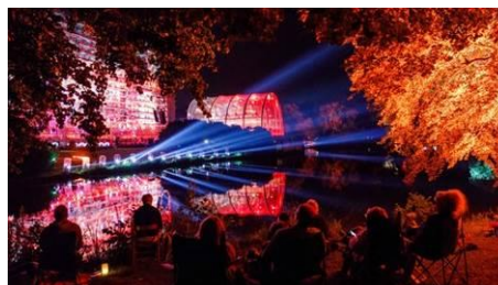
NDR Open Air Oper 2018