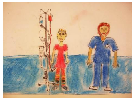
Kinderzeichnung von einem Arzt und einem Kind

Der Verein wirbt für kleine und große Spenden, auch für Erbschaften, und trägt jährlich ca. 1 Mio. Euro zusammen. Damit werden für die Eltern kostenlose Elternwohnungen finanziert, damit sie in unmittelbarer Nähe des erkrankten Kindes sein können, zusätzliches Pflegepersonal und Ärzte, Künstler, Sportwissenschaftler und selbst aufwendige Forschungsvorhaben werden finanziell unterstützt.