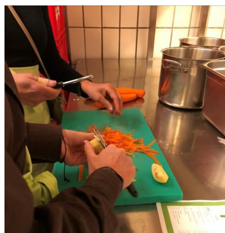
Gemeinsam kochen - Gemeinsam essen